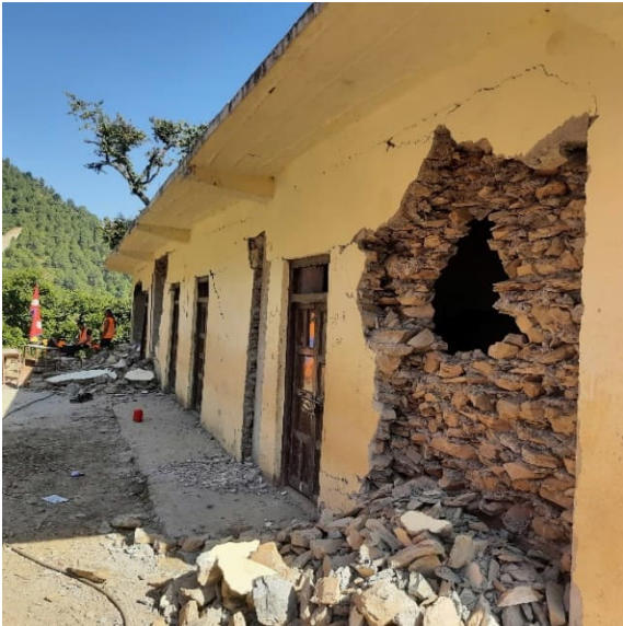
Jajarkotin työskentelyalueemme kouluja tuhoutui pahasti maanjäristyksessä viime vuonna.

Yhdeksän kuukautta työn parista poissaolleen olen tutustunut työmme etenemiseen heti alkuun lukemalla Nepalin hankkeidemme tuoreita vuosiraportteja, joita nepalilaiset yhteistyöjärjestömme ovat laatineet. Olen saanut lukea työn etenemisestä valtavalla ylpeydellä. Alla joitakin työmme tuloksia: