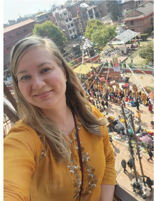
Kathmandun kotimme edustalla saa ihmetellä paikallista kulttuuria. Aukiolla järjestetään lukuisia tapahtumia, pyöräilykilpailuista meditoititilaisuuksiin.