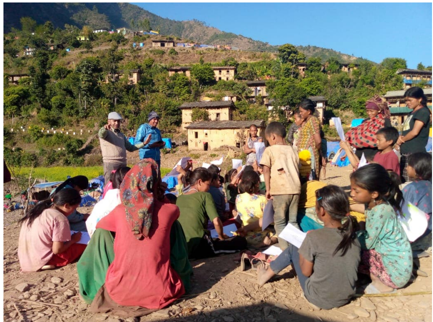
Lapset ja perheet saivat psykososiaalista tukea maanjäristyksen jälkeen.