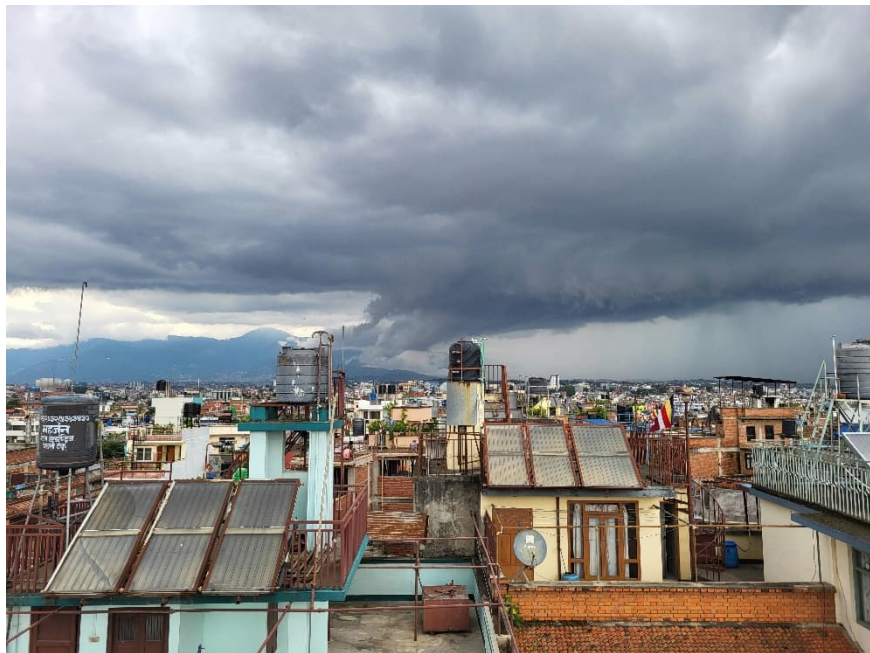
Monsuunikausi on ollut tänä vuonna voimakas ja aiheuttanut tuhoja ympäri Nepalia. Kuva Kathmandun kotini katolta.

Nepal on hyvin altis erilaisille luonnonmullistuksille ja katastrofeille, kuten viime vuotinen maanjäristys osoitti. Nyt Nepalissa on meneillään voimakas vuosittainen sade- eli monsuunikausi, joka kestää yleensä kesäkuusta elokuun vaihteeseen. Se tietää täällä monia haasteita: sateet ovat johtaneet rajuihin tulviin sekä maanvyörymiin ympäri maata. Matkustaminen työalueille hankaloituu.